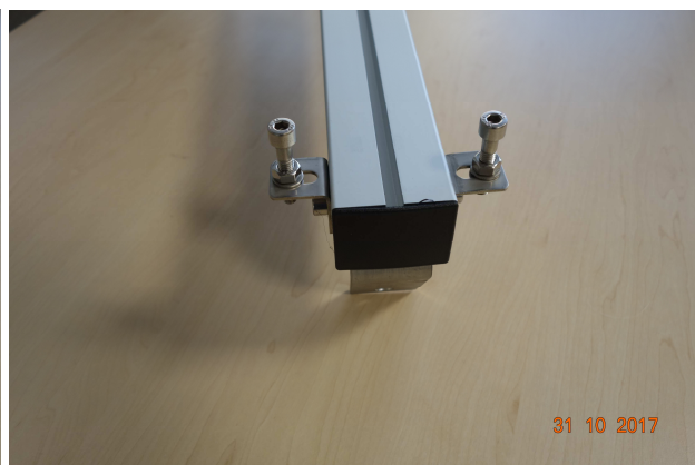
Così è come si presenta il supporto dopo aver ruotato di 180° il fermo anticaduta