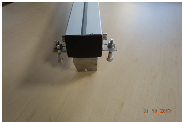
Così è come viene fornito il supporto

Prima di fissare i moduli fotovoltaici sul braccio superiore del supporto (quello di dimensione maggiore e sezione rettangolare) ruotate di 180° il fermo anticaduta e verificate che la vite risulti in posizione corretta per il tipo di modulo fotovoltaico utilizzato. Eventualmente fate le opportune regolazioni agendo sulla posizione dell'aletta in acciaio e/o sui dadi che fermano la vite.